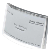
Porte-badges adhésif velcro amovible HPVG510